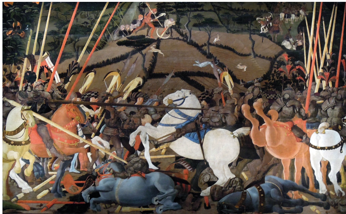
Paolo Uccello - La battaglia di San Romano

antibatteriche e antivirali (anche anti-HIV e anti-HSV-1 ossia il virus dell'herpes simplex 1), abbassa la colesterolemia, riduce l'aggregazione delle piastrine. Immuno Stimulator è un integratore che, oltre alla vitamina C , accorpa gli estratti liofilizzati di due vegetali, l' echinacea e l' aloe Vera , e di sei funghi dalle straordinarie caratteristiche tra cui il Ganoderma Lucidum (conosciuto anche come Reishi o "fungo dell'immortalità"), il Grifola Frondosa (conosciuto anche come Maitake ), il Lentinus Edodes già citato. Il processo di liofilizzazione degli estratti potenzia notevolmente l'efficacia degli ingredienti che compongono questo integratore che aiuta le naturali difese dell'organismo e la funzionalità delle prime vie respiratorie per cui si rivela utile in quanto offre un ulteriore supporto al sistema immunitario sia per chi appartiene alle categorie a rischio e si è vaccinato sia per chi, per motivi vari, non si è vaccinato. Ricordiamo che i due terzi delle cellule del sistema immunitario si trovano nell'intestino e basilare importanza riveste il microbiota che è responsabile della nostra buona salute e che ha un ruolo fondamentale nello sviluppo di un sistema immunitario forte e bilanciato . Ma non basta: recenti studi hanno dimostrato la sua influenza nel mantenimento del peso al di sotto dell'obesità . L'alterazione del microbiota intestinale, secondo