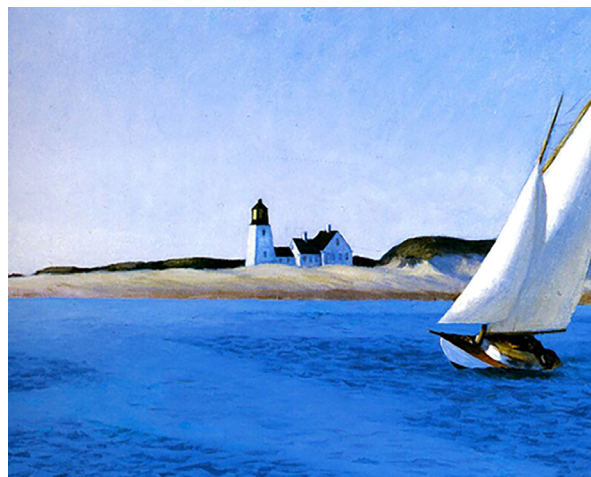
La lunga tratta - Edward Hopper

molare la sintesi di acido urocanico, sostanza naturale che assorbe i raggi UVB. Quando si rompe il fisiologico equilibrio tra produzione ed eliminazione dei "radicali liberi" si parla di stress ossidativo , un fattore importante nella genesi di numerose patologie come l'invecchiamento precoce, il morbo di Parkinson, la demenza di Alzheimer, il diabete mellito, l'obesità, la psoriasi, l'ipertensione, l'infarto, l'ictus, alcune forme tumorali, ecc. Molte situazioni inducono stress ossidativo tra le quali un'alimentazione sbagliata; le infezioni; i processi infiammatori; l'abuso di alcol; il fumo di sigarette; i gas inquinanti e le sostanze tossiche in genere che innescano un processo infiammatorio che le difese antiossidanti non riescono a contrastare; stress emotivo e psicologico. A causa della continua esposizione ad agenti potenzialmente ossidanti come le radiazioni solari e gli inquinanti atmosferici, uno dei principali bersagli dello stress ossidativo è la pelle . Anche l'attività fisica, alla quale ci si dedica maggiormente durante